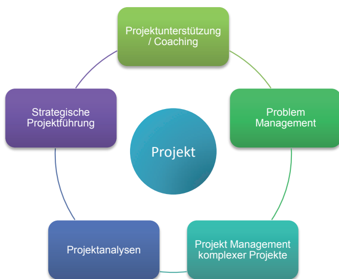
Portfolio im Bereich Project Services

Unter Project Services verstehen wir unser Angebot rund ums Thema Projekte. Unsere erfahrenen und gut ausgebildeten Mitarbeiter unterstützen Sie in allen Belangen,